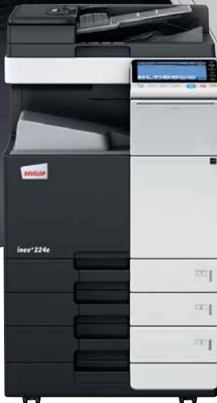
ineo+ 224e mit Papierkassette (PC-210) und Dual Scan Originalinzug (DF-701)