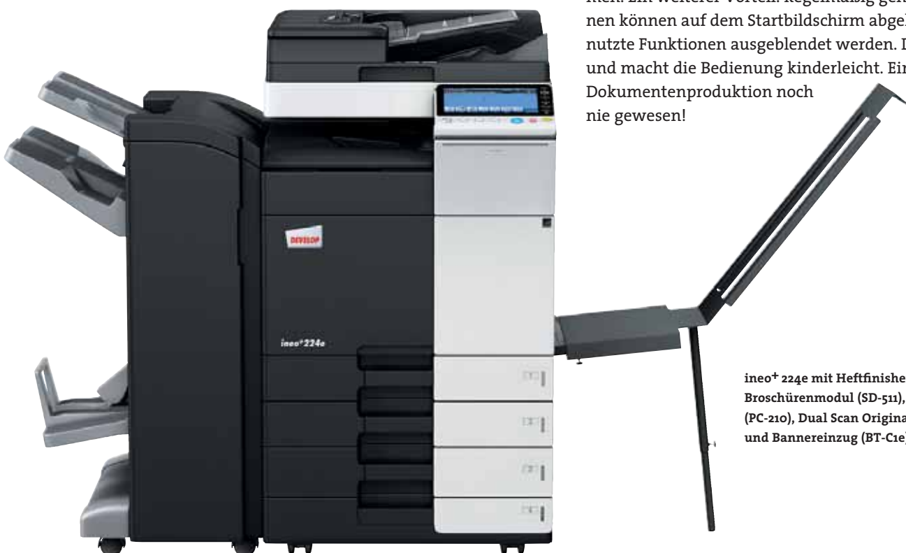
ineo+ 224e mit Heftfinisher (FS-534), Broschürenmodul (SD-511), Papierkassette (PC-210), Dual Scan Originaleinzug (DF-701) und Bannereinzug (BT-C1e)

Viele Multifunktionssysteme sind alles andere als anwenderfreundlich. Doch damit ist nun Schluss – die ineo+ 224e ist für Ihre Anforderungen wie geschaffen. Das Bedienungskonzept ist intuitiv erfassbar und genauso leicht verständlich wie das eines Smartphones oder Tablet-PCs. Der kapazitive 9 Zoll-Touchscreen verfügt über vertraute Funktionen wie flick, drag&drop und pinch in&out, sodass die Bedienbarkeit ganz einfach ist. Und dank der neuen Menüstruktur lassen sich alle Funktionen auf einen Blick erfassen und die gewünschten Einstellungen mit nur wenigen Berührungen vornehmen. Ein weiterer Vorteil: Regelmäßig genutzte Funktionen können auf dem Startbildschirm abgelegt, ungenutzte Funktionen ausgeblendet werden. Das spart Zeit und macht die Bedienung kinderleicht. Einfacher ist Dokumentenproduktion noch nie gewesen!