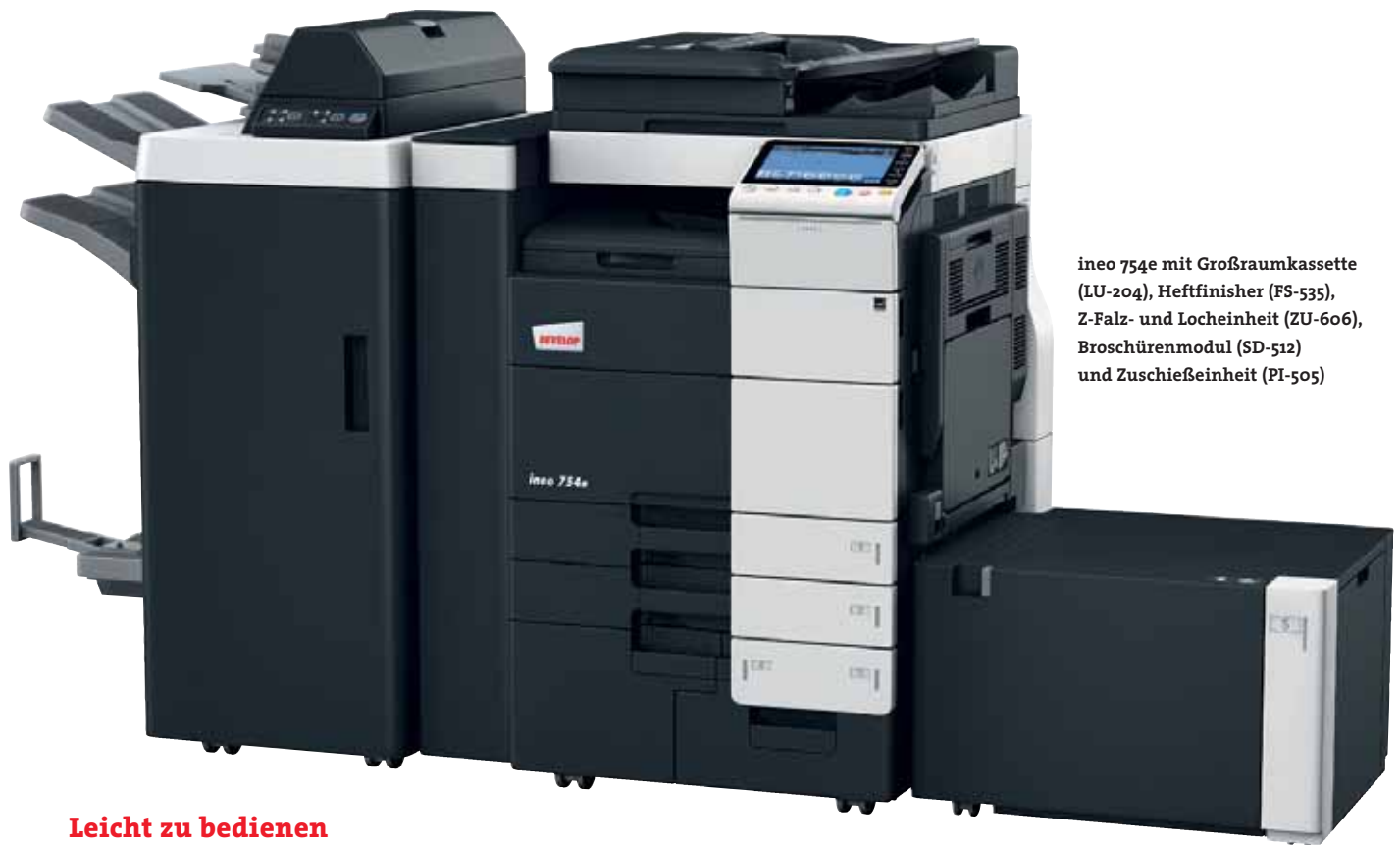
ineo 754e mit Großraumkassette (LU-204), Heftfinisher (FS-535), Z-Falz- und Locheinheit (ZU-606), Broschürenmodul (SD-512) und Zuschießeinheit (PI-505)