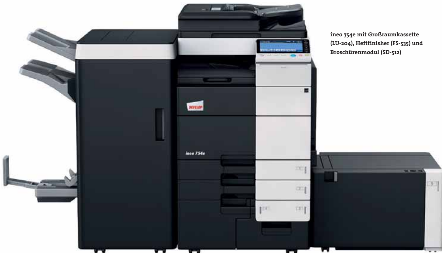
ineo 754e mit Großraumkassette (LU-204), Heftfinisher (FS-535) und Broschürenmodul (SD-512)

Viren, Trojaner, Hacker-Angriffe: Heutzutage kann kein Unternehmen es sich leisten, die wachsenden Erfordernisse der IT-Sicherheit zu ignorieren. Daher ist die ineo 754e nach ISO 15408 EAL 3 zertifiziert, dem höchsten Sicherheitsstandard für Multifunktionssysteme. Außerdem gehören zahlreiche Funktionen zur Datensicherheit, wie beispielsweise die IPsec-Verschlüsselung, für eine sichere Kommunikation innerhalb Ihres Unternehmens, zur Standardausstattung. Dank serienmäßiger Festplattenverschlüsselung und effektiver Authentifizierungstechnologie ist es ausgeschlossen, dass vertrauliche Dokumente oder Datensätze in die falschen Hände geraten. Auf diese Weise schützt DEVELOP Ihre sensiblen Daten – heute und in Zukunft.