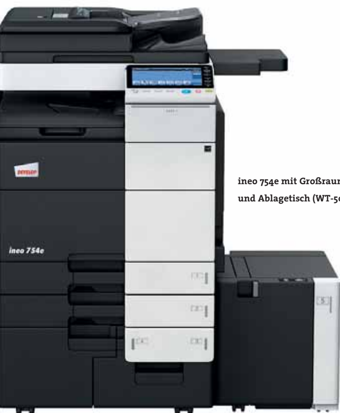
ineo 754e mit Großraumkassette (LU-301) und Ablagetisch (WT-506)

Die ineo 754e druckt und kopiert 75 Blätter im DIN-A4-Format pro Minute – lassen Sie das System für sich arbeiten, während Sie und Ihr Team sich auf die Kernaufgaben konzentrieren können. Diese hohe Geschwindigkeit hat insbesondere dann einen Mehrwert, wenn – wie bei einem abteilungsübergreifenden Drucksystem oder einer Hausdruckerei – mehrere Benutzer auf die ineo 754e zugreifen. Dadurch werden Warteschlangen vermieden und Überbrückungszeiten verkürzt. Da das System bei voller Geschwindigkeit doppelseitig druckt und kopiert, wird bei umfangreichen Aufträgen gleichzeitig der Papierverbrauch gesenkt. So sparen Sie zusätzlich Kosten!