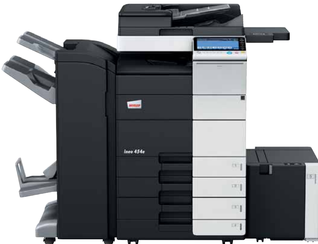
ineo 454e mit Heft- und Broschüren- finisher (FS-534SD), Papierkassette (PC-210), Großraumkassette (LU-301) und Ablagetisch (WT-506)

Jedes dieser Multifunktionssysteme – ineo 224e, ineo 284e, ineo 364e, ineo 454e und ineo 554e – ist einfach zu bedienen und hat eine große Bandbreite zusätzlicher Funktionen, die die tägliche Arbeit im Büro entscheidend erleichtern. Wenn beim Drucken, Kopieren und Scannen Zeit gespart wird, bleibt mehr Zeit für die eigentlichen Kernaufgaben – und das steigert die Produktivität im Büro.