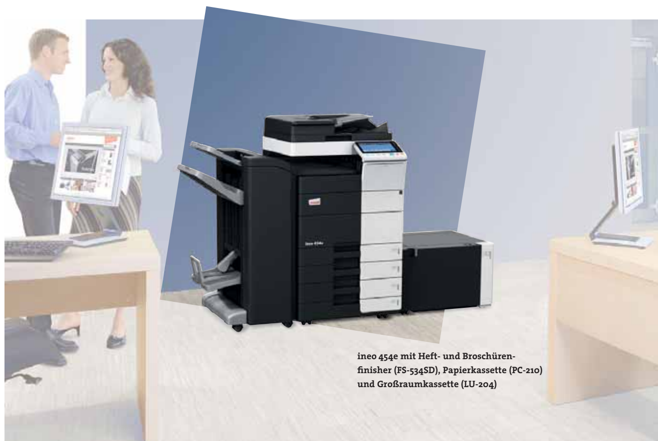
ineo 454e mit Heft- und Broschürenfinisher (FS-534SD), Papierkassette (PC-210) und Großraumkassette (LU-204)

Zahlreiche Energiesparmaßnahmen sorgen bei den ineo Schwarzweißsystemen dafür, dass der Energieverbrauch um bis zu 40 Prozent unter denen der Vorgängermodelle liegt. Das spart zum einen Geld, hilft aber auch der Umwelt. Die neue ineo e-Serie ist nicht nur gut für das Unternehmen, sondern verbessert auch dessen ökologischen Fußabdruck.