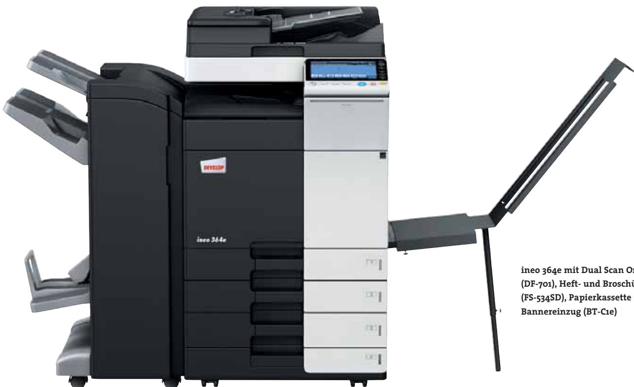
ineo 364e mit Dual Scan Originaleinzug (DF-701), Heft- und Broschürenfinisher (FS-534SD), Papierkassette (PC-210) und Bannereinzug (BT-C1e)

Jedes dieser Multifunktionssysteme – ineo 224e, ineo 284e, ineo 364e, ineo 454e und ineo 554e – ist einfach zu bedienen und hat eine große Bandbreite zusätzlicher Funktionen, die die tägliche Arbeit im Büro entscheidend erleichtern. Wenn beim Drucken, Kopieren und Scannen Zeit gespart wird, bleibt mehr Zeit für die eigentlichen Kernaufgaben – und das steigert die Produktivität im Büro.