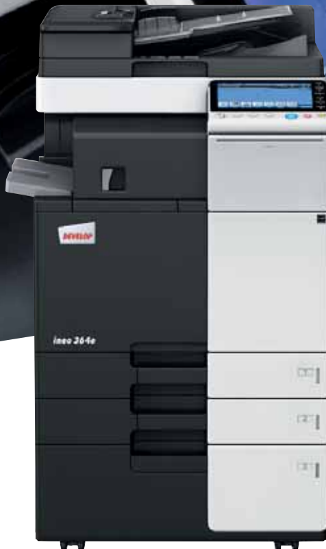
inoe 364e mit Originaleinzug (DF-624), interner Finisher (FS-533) und Großraumkassette (PC-410)