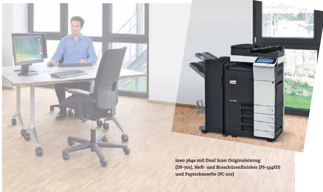
ineo 364e mit Dual Scan Originaleinzug (DF-701), Heft- und Broschürenfinisher (FS-534SD) und Papierkassette (PC-210)

Zahlreiche Energiesparmaßnahmen sorgen bei den ineo Schwarzweißsystemen dafür, dass der Energieverbrauch um bis zu 40 Prozent unter denen der Vorgängermodelle liegt. Das spart zum einen Geld, hilft aber auch der Umwelt. Die neue ineo e-Serie ist nicht nur gut für das Unternehmen, sondern verbessert auch dessen ökologischen Fußabdruck.