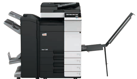
ineo+ 368 mit Dual Scan Original-einzug (DF-704), Heftfinisher mit Broschüreeneinheit (FS-534SD), Bannereinzug (BT-C1e) und Papiereinzug (PC-210)