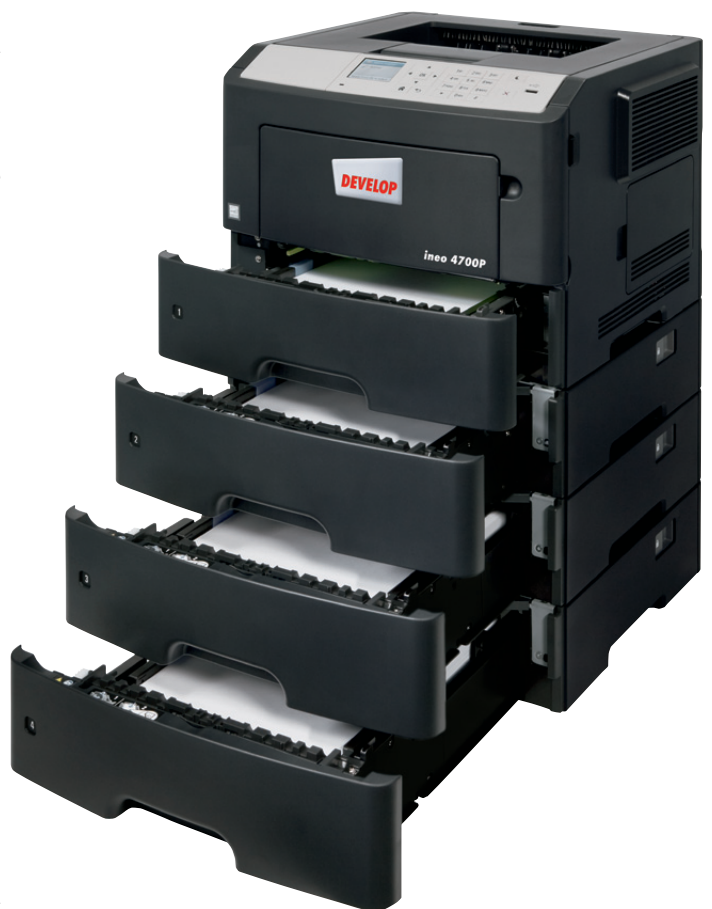
ineo 4700P mit drei zusätzlichen Papierkassetten (PF-P12)

Ist Ihr derzeitiges Drucksystem unübersichtlich und schwer zu bedienen? Dann steigen Sie um auf die ineo 4700P. Das 2,4-Zoll Farbdisplay ist intuitiv zu bedienen und hervorgehobene Menüs zeigen dem Benutzer den Systemstatus sowie ausgewählte Bedienungsoptionen und -einstellungen. Mehr noch – die Navigation über Ordnerstrukturen ist übersichtlich und erleichtert Ihnen die Bedienung. Der Bedienkomfort wird Sie und Ihr Team sofort positiv beeindrucken und es bleibt mehr Zeit für die wichtigen Kernaufgaben. Und bei der ineo 4700P brauchen Sie kein umfangreiches Bedienungshandbuch zu fürchten: sie lässt sich intuitiv bedienen.